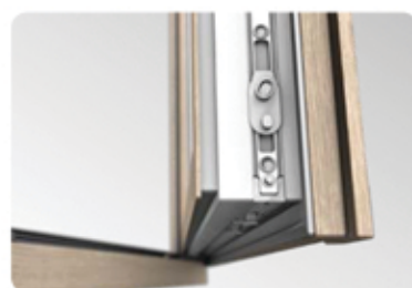
Högkvalitativt Maco Multi Matic KS beslag levereras som standard med två inbrottsäkra pluggar.