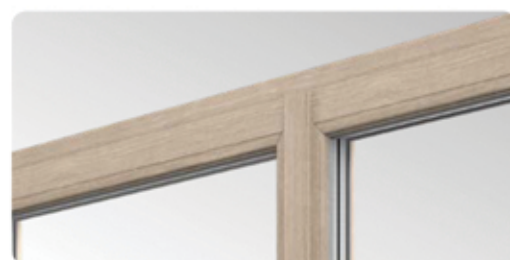
Smala profiler med smal mittstolpe är utrustade med dubbeltätning, vilket är en nyhet på marknaden vid sådana lösningar.