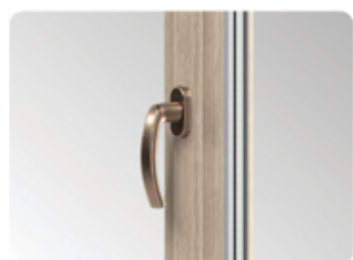
Elegant handtag i aluminium betonar fönstrets unika karaktär.

Ett rikt skala av 43 Renolit faner garanterar anpassning av fönsters färg till varje interiör och fasad.